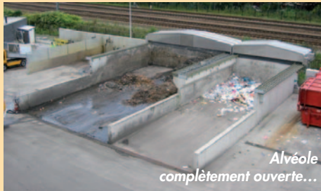
Alvéole complètement ouverte...