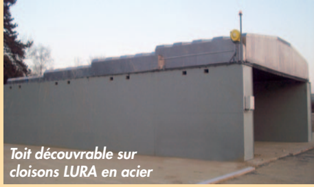
Toit découvrable sur cloisons LURA en acier