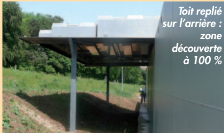
Toit replié sur l'arrière : zone découverte à 100 %